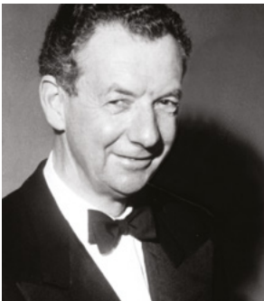
Benjamin Britten gaf vorm aan de vernieuwende muziek in Groot-Brittannië in de 20 e eeuw

onder liederen, werken voor koor, en instrumentale muziek. Al bleef hij modern, hij gebruikte een tonale muzikale taal gekoppeld aan vindingrijke retorische gebaren die zijn muziek een spontane aantrekkelijkheid verlenen.