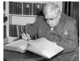
Ralph Vaughan Williams (hier in 1954) leidde zijn generatie in de zoektocht naar een ware Engelse muzikale stijl

[ NATIONALE STIJL ] Ralph Vaughan Williams was de leidende componist van zijn generatie, en een belangrijke pionier in de creatie van een eigen Engelse muzikale stijl. Ook al wist hij op vroege leeftijd dat hij componist wilde worden, toch was het een hele worsteling om die droom waar te maken. Hij baande zich een weg via een hernieuwde belangstelling voor Engelse muzikale tradities, zowel volks als uit oudere periodes van de Engelse muziekgeschiedenis (in het bijzonder de periodes van Elizabeth I en James I). Zijn symfonieën worden gewoonlijk beschouwd als zijn belangrijkste werken, maar eigenlijk vormt het lied de rode draad doorheen zijn oeuvre.