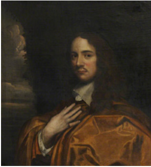
Andrew Marvell, een van de Engelse 'metaphysical poets', schreef naast lyrische poëzie ook satirisch proza en zelfs politieke pamfletten