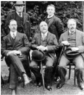
De 'English Musical Renaissance' werd getrokken door componisten als Hubert Parry (achteraan links), Edward German (achteraan rechts), Dan Godfrey (vooraan links), Alexander Mackenzie (vooraan midden) en Charles Villiers Stanford (vooraan rechts), hier geportretteerd in 1910