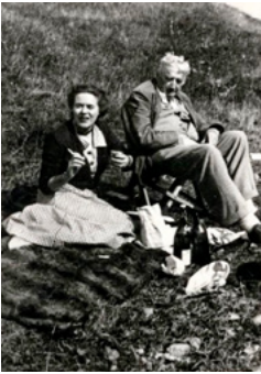
Ralph Vaughan Williams op een picknick met zijn vrouw

lenen ze zich uitstekend tot muzikale zettingen. De zes gedichten die Vaughan Williams koos, komen uit verschillende delen van de verzameling. Ze zijn dan opnieuw geordend om een verhaal te vormen waarin een verstoorde idylle de achtergrond vormt voor meer persoonlijke reflecties over het leven, de dood, en finale verlossing.